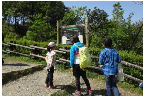
森の家から木工体験館までの道のり(秋)