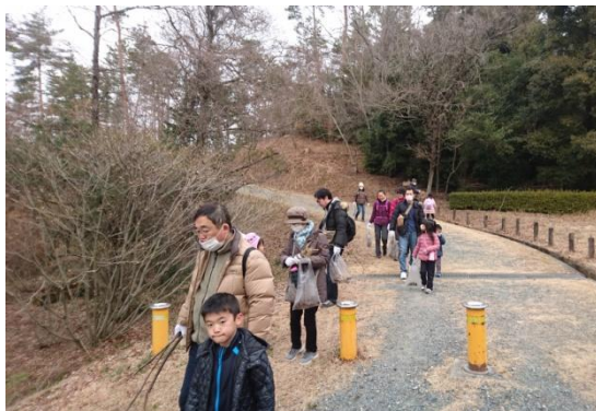
森の家から木工体験館までの道のり(冬)