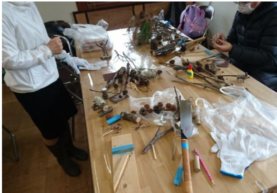
道具と素材を揃えて創作活動開始