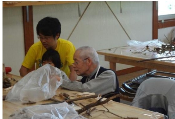
木工体験館での説明風景 (作りたいたいものを一緒に考え、教えてください。)