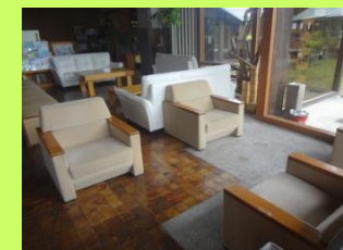
館内 席間 距離確保