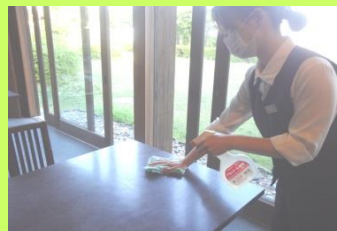
店内テーブル除菌