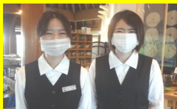
スタッフのマスク着用

「森の家」「レストランまつぼっくり」では コロナウイルス 感染予防に 取り組んでいます。