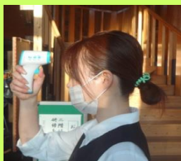
スタッフの検温管理

お客様には大変ご迷惑、ご不便をお掛けいたしますが、何卒ご理解くださいますようお願い申し上げます。