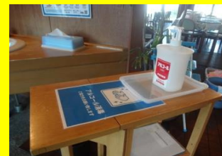
消毒用アルコールの設置

「森の家」「レストランまつぼっくり」では コロナウイルス 感染予防に 取り組んでいます。