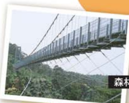
森林公園内吊り橋